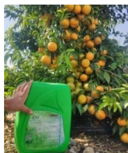
【たわわに実ったミカン】