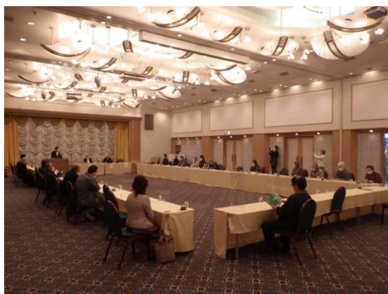
写真 講演会の様子

講演会の参加者は農業(稲作、野菜、果樹)や養鶏業を営んでいる方達が多かったことから、EM 活用に関心が高く、活発な質疑応答が交わされました。