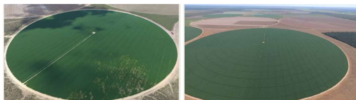
【線虫被害から回復した大豆畑:右 EM 使用前 左 EM 使用後】

2015年より政策として州全体を有機農業化するために、EM資材を無償で提供し、EM有機堆肥の作り方を農家へ指導するなど、約14万人がEMの活用方法を学び、約5,700ヘクタールの農地でEMが活用されました。シッキム州では州内全ての農地が有機認証を取得し、この州全体で有機農業を推進するとした政策は2018年に国連から最優秀政策賞を受賞しました。