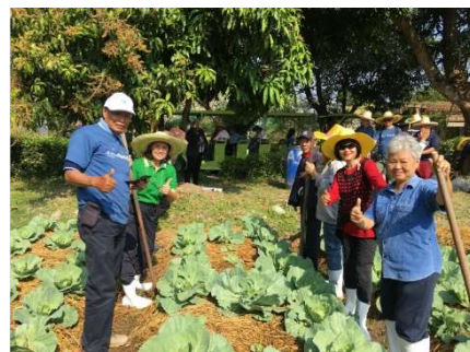
【自然農法研修センターで学ぶ研修生たち】

次世代の農業の担い手を育成するのにも EM は役立っています。タイのサラブリー県には約 30 年前、政府によって開発された土地がありました。そこはやせていて農業に不向きな場所でした。しかし、現在その土地は、EM を活用した農業について学べる研修センターとして、自然農法を教える場となっています。これまでの 30 年間で 25 万人の研修生を受け入れ、EM をアジア全域に広げるだけでなく、自然農法のリーダーを養成する場所として重要な役割を担っています。また、コスタリカにあるアース大学は、農業専科大学で中南米の若手人材育成を目的に設立されました。大学では EM を勉強できるコースもあり、学生は学んだことを自国に持ち帰り農業の担い手となっています。