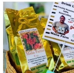
【オーガニックコーヒー】