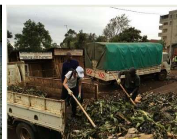
【ケニア: 回収されるゴミ】

弊社の現地法人 EM Technologies 社は、そうしたゴミを EM で堆肥にし、使える資源として農地に戻し、収穫された作物を、エイズにより親を失った子たちの孤児院に寄付するだけでなく、孤児院でも農業が出来る様に指導する活動をしています。さらに、ポーランドでは「地球トイレ」活動が実施され、多くの人が集まる場所に設置されているトイレに EM を活用して悪臭対策をする活動が行われています。