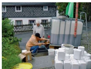
【ドイツ: 配布される EM】

また、南アフリカのケニアでは、町の野菜市場などに散乱したゴミから発生する悪臭や、ハエ、蚊によって環境汚染、健康被害が問題となっていました。