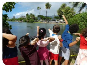
【EM 団子投入イベント】

また、アラブ首長国連邦にある人口の湖では、水の循環機能がない影響で藻が発生し景観を損ねていましたが、EM を使って水質を改善しました。特に EM 団子は河川の水質を改善する事から、世界各国で EM 団子を環境浄化のために河川に投入するプロジェクトやイベントが毎年行われています。